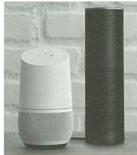
写真：左=グーグルホーム、右=アマゾンエコー (案山子)

Gartnerのレポートでは、世界のスマートスピーカーの市場規模は、2015年3.6億ドル(390億円)、2020年に21億ドル(2,275億円)と予想している。