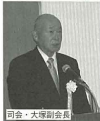
司会・大塚副会長